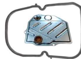
Consultar (*) modelo de filtro (imagen: MERC126.FIL01)

Al montar el cárter de aceite, asegúrese de que los tornillos están apretados en la secuencia correcta, y que el par de apriete prescrito se aplica. Los tornillos no llevan tope si nos pasamos apretando se dobla el cárter.