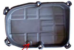
Tapón vaciado (Vista interior)

Abrir el tapón de vaciado para drenar el aceite viejo de la transmisión. Asegúrese de que el aceite se recoge en un recipiente adecuado.